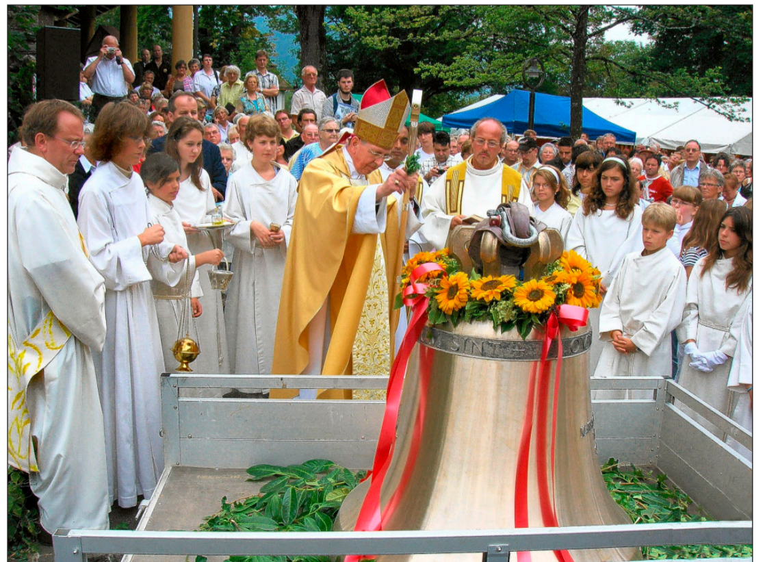
Bischof Kurt Koch segnet die vierte Glocke, die zum 100. Geburtstag der römisch-katholischen Kirche Interlaken das Geläut vervollständigt.

Gestern Sonntag aber feierte die grosse Festgemeinde, welche die Kirche aus allen Nähten hatte platzen lassen, noch lange mit «Festweihen», Bratwürsten und «Jubiläumsschokolade». SHU